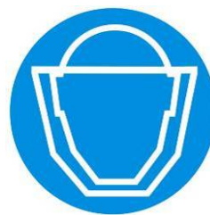
Protezione obbligatoria del viso