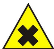
Sostanze nocive / irritanti