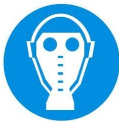
Protezione obbligatoria delle vie respiratorie