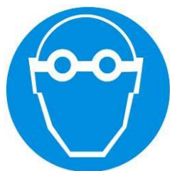
Protezione obbligatoria degli occhi