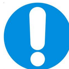
Obbligo generico (con eventuale cartello supplementare)