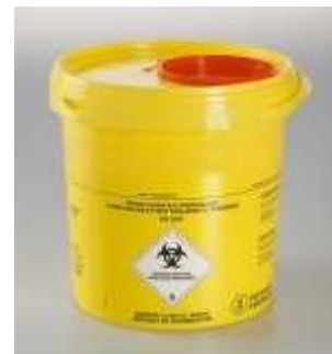
Contenitore aghi e taglienti

In generale, il personale dell'Appaltatore deve porre particolare attenzione alla vetreria o agli oggetti taglienti/pungenti presenti in questa tipologia di laboratori; i taglienti potenzialmente infetti al termine dell'utilizzo sono depositati temporaneamente, in attesa dell'idoneo smaltimento, in contenitori chiusi di sicurezza, che non devono assolutamente essere aperti né dal personale dell'Appaltatore né dal personale UniTrento.