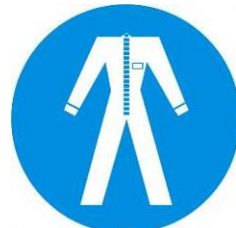
Protezione obbligatoria del corpo