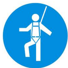
Protezione individuale contro le cadute