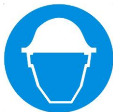
Casco di protezione obbligatoria