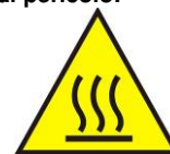
Superficie ad alta temperatura