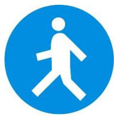
Passaggio obbligatorio per i pedoni