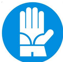
Guanti di protezione obbligatoria