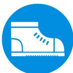
Calzature di sicurezza obbligatoria