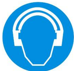
Protezione obbligatoria dell'udito