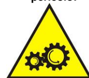
Organi meccanici in movimento